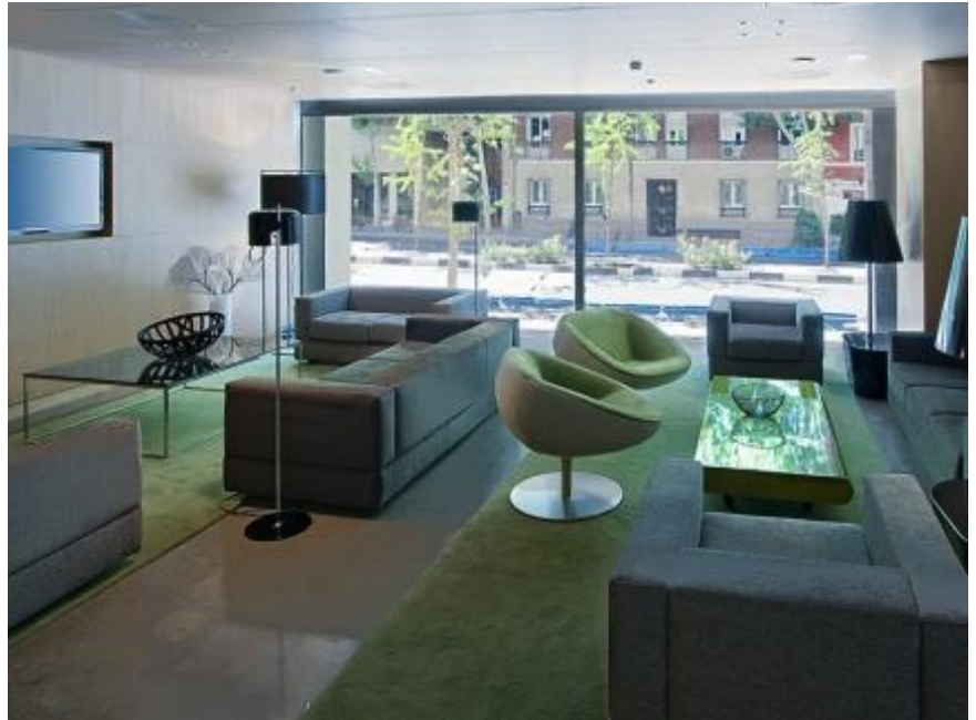
L'hôtel, moderne et design, est situé dans le centre de Madrid, dans l'élégant quartier de Salamanca.

Niveau supérieur. Hôtel 4* d'une chaîne réputée et moderne, Localisation géographique favorable, dans le centre-ville, et bien desservie, Classement Tripadvisor : 52 ème /447 hôtels + Certificat d'Excellence + 8,4/10 sur Booking.com