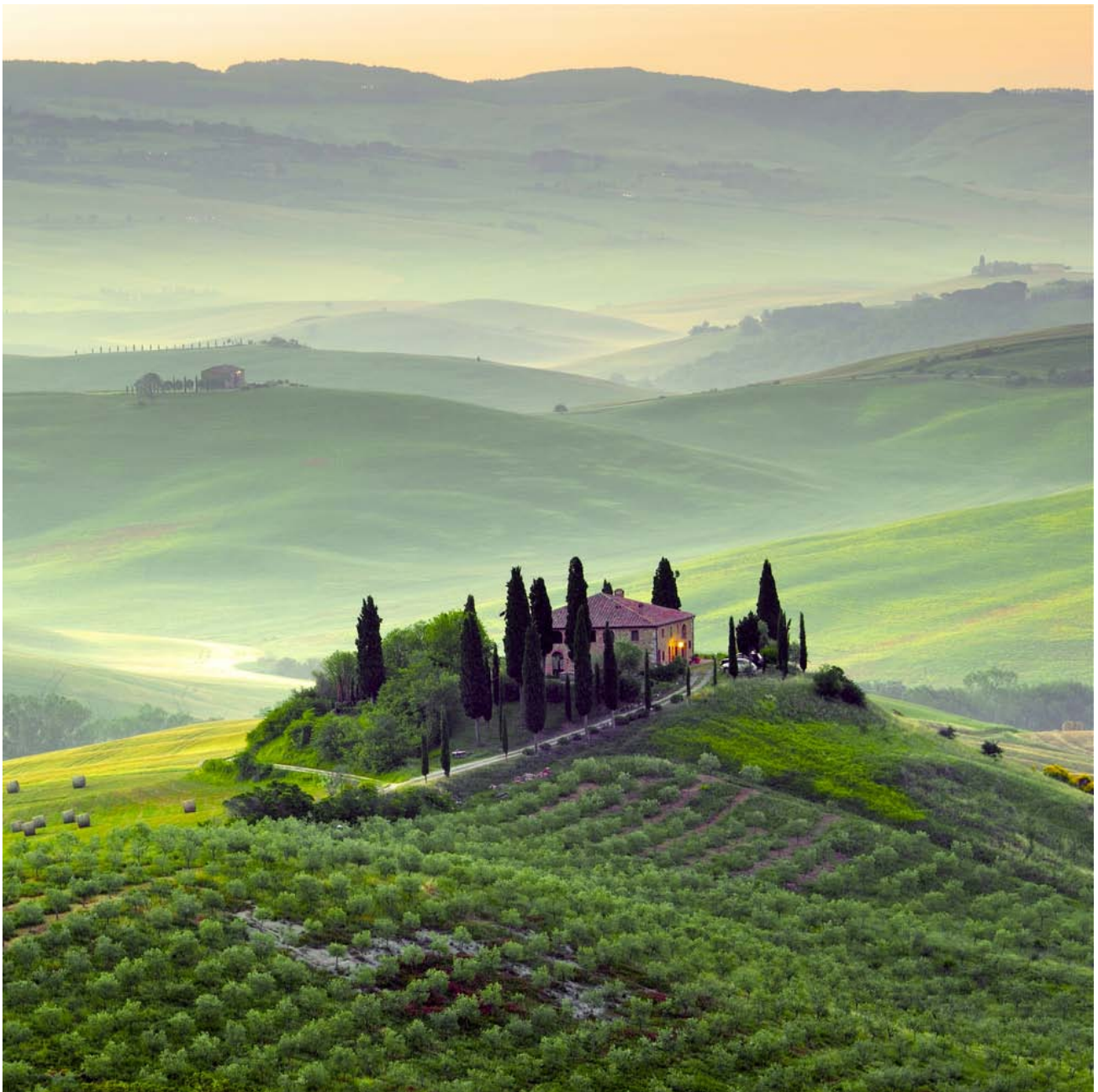
Vue sublime du Chianti au petit matin

En réalité, Florence est située au cœur de l'une des plus belles régions qui soit et abrite, dans ses environs, de magnifiques joyaux à côté desquels il serait dommage de passer.