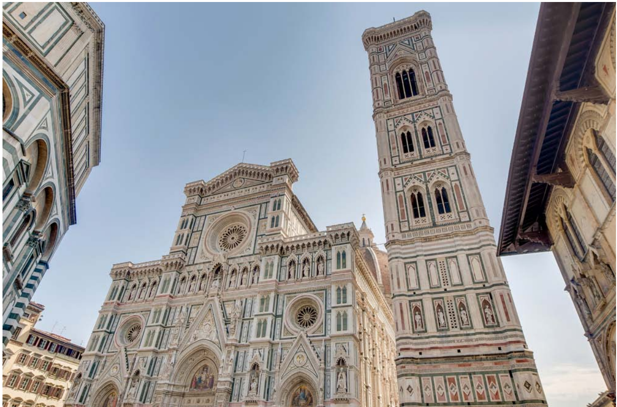
La Cattedrale Santa Maria del Fiore, le Campanile di Giotto, le Battistero