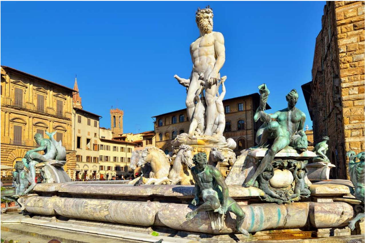
La fontaine de Neptune de Florence (Fontana del Nettuno), appelée aussi Il Biancone située sur la Piazza della Signoria, juste à côté du Palazzo Vecchio, a pour vocation d'afficher la splendeur des Médicis.

Vous rejoindrez la PIAZZA DELLA SIGNORIA qui est le cœur de la vie politique florentine depuis le Moyen Age et en affiche de nombreux emblèmes : Vous y admirerez le Palazzo Vecchio, dont l'extérieur austère cache le luxe d'une résidence du XVI ème siècle destinée à célébrer la gloire de Côme 1 er – vous pouvez, du reste, visiter les intérieurs – ainsi qu'une impressionnante collection de chefs-d'œuvre de la sculpture dont les plus célèbres sont la Fontana di Nettuno ainsi que la statue équestre de Côme de Médicis.