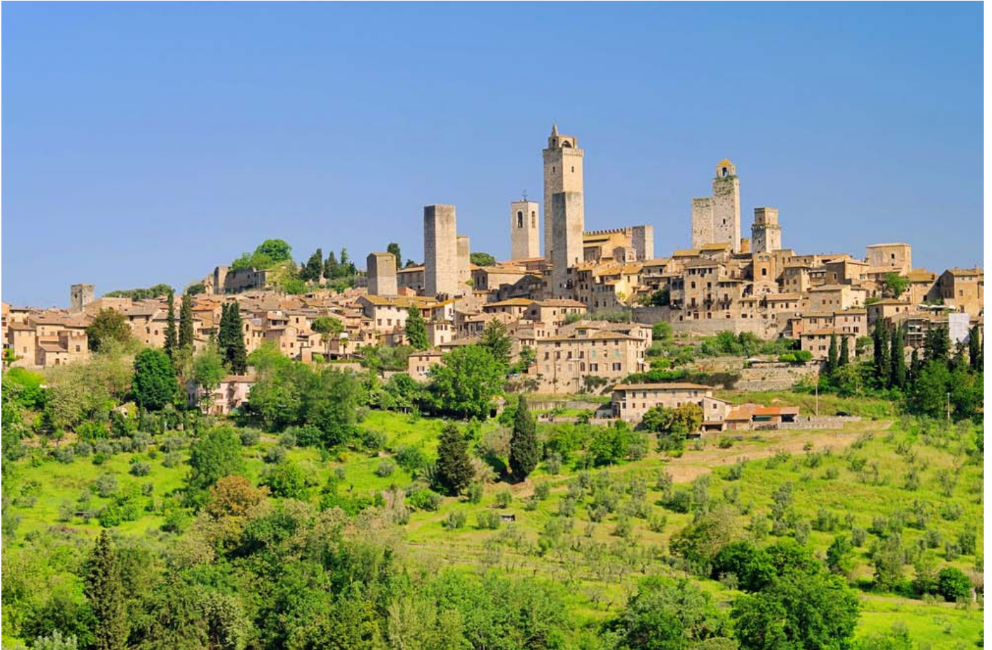
San Gimignano et ses 14 tours