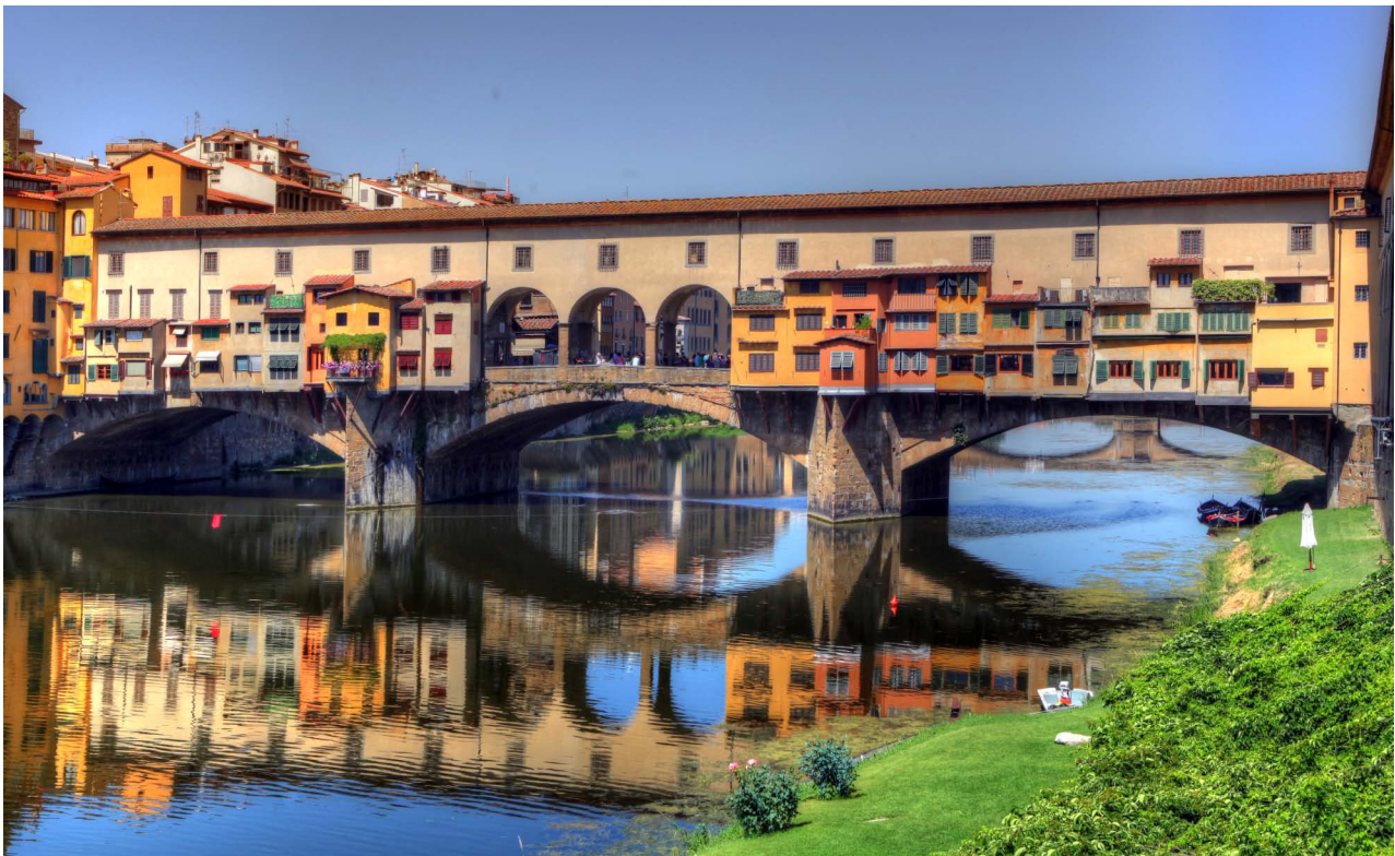
Enjambant l'Arno, le célèbre Ponte Vecchio, à la fois pont, rue piétonne, galerie marchande ...

On peut, de fait y admirer des toiles de Léonard de Vinci, Michel-Ange, Raphaël , Titien, entre autres.