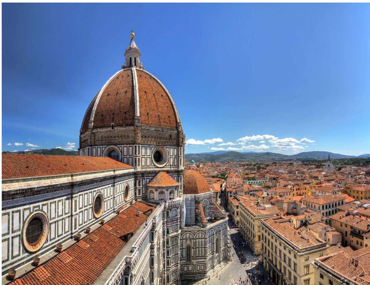
La cathédrale Santa Maria del Fiore