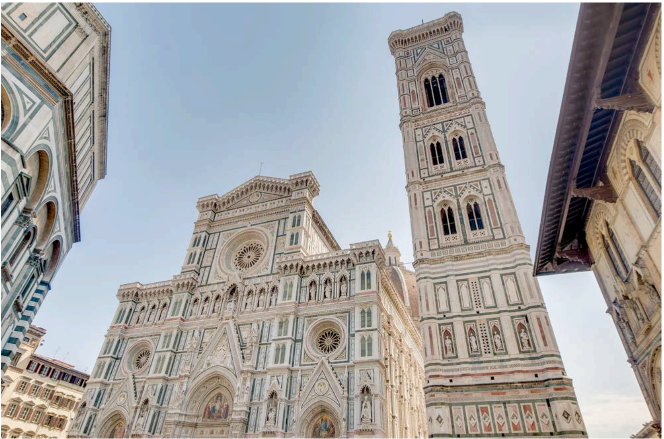
La Cattedrale Santa Maria del Fiore, le Campanile di Giotto, le Battistero