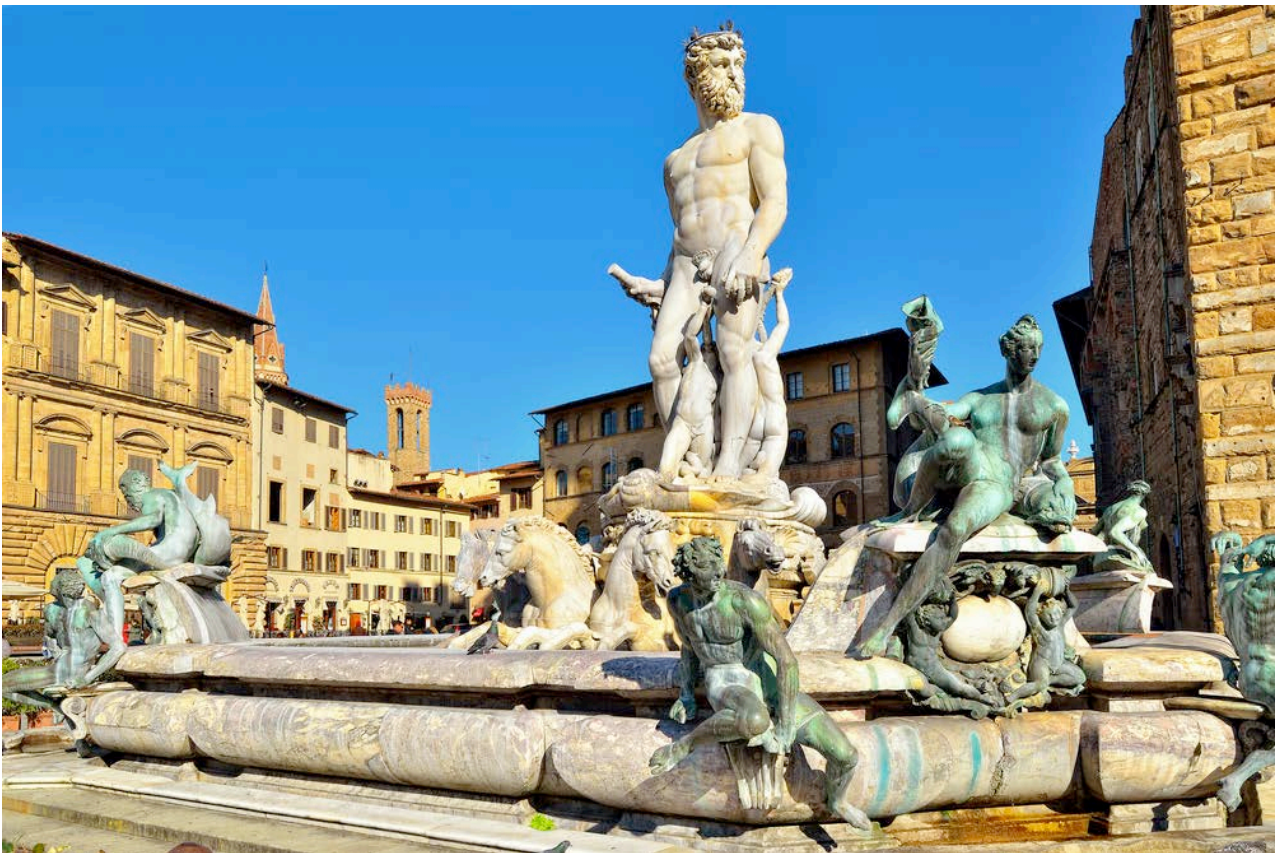
La fontaine de Neptune de Florence (Fontana del Nettuno), appelée aussi Il Biancone située sur la Piazza della Signoria, juste à côté du Palazzo Vecchio, a pour vocation d'afficher la splendeur des Médicis.

Vous rejoindrez la PIAZZA DELLA SIGNORIA qui est le cœur de la vie politique florentine depuis le Moyen Age et en affiche de nombreux emblèmes : Vous y admirerez le PALAZZO VECCHIO , dont l'extérieur austère cache le luxe d'une résidence du XVIème siècle destinée à célébrer la gloire de Côme 1 er – vous pouvez, du reste, visiter les intérieurs – ainsi qu'une impressionnante collection de chefs-d'œuvre de la sculpture dont les plus célèbres sont la Fontana di Nettuno ainsi que la statue équestre de Côme de Médicis.