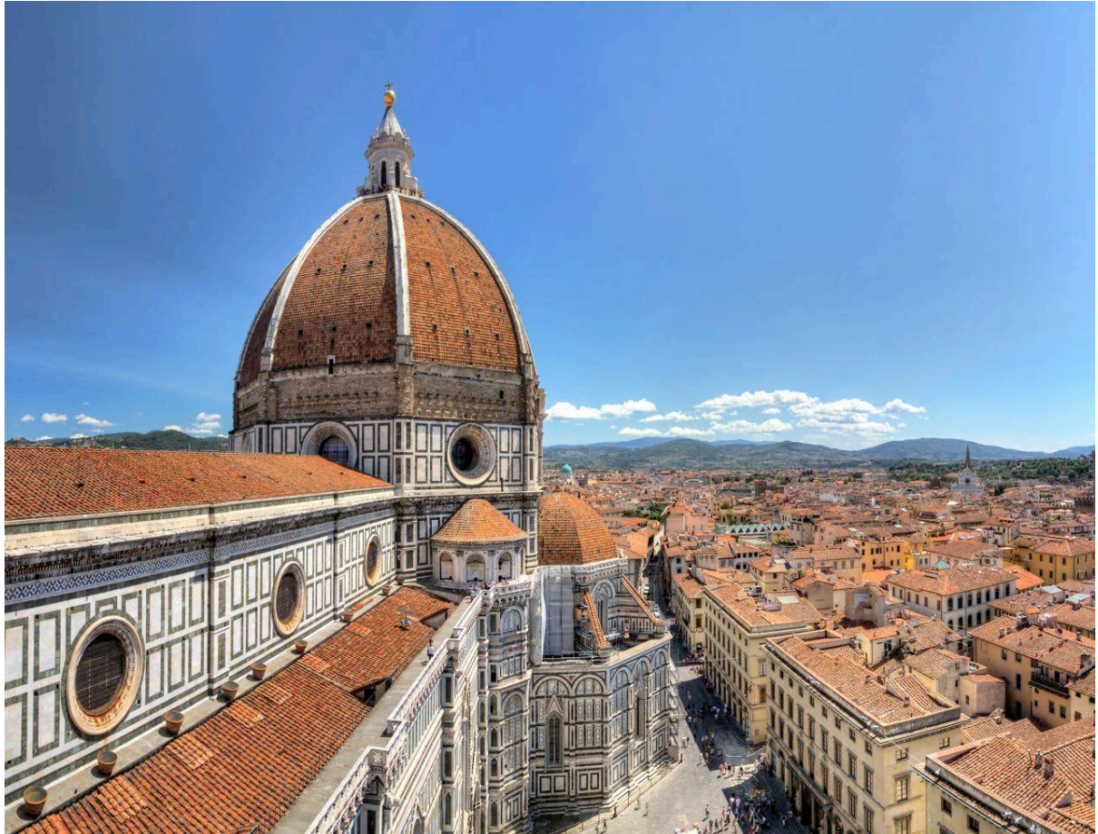
La cathédrale Santa Maria del Fiore

FLORENCE L'ESTHETE - L'ART DE VIVRE A L'ITALIENNE - NOS SUGGESTIONS TOURISTIQUES COMITE D'ENTREPRISE DE LA BANQUE DE FRANCE PARIS - 20/23 septembre 2014