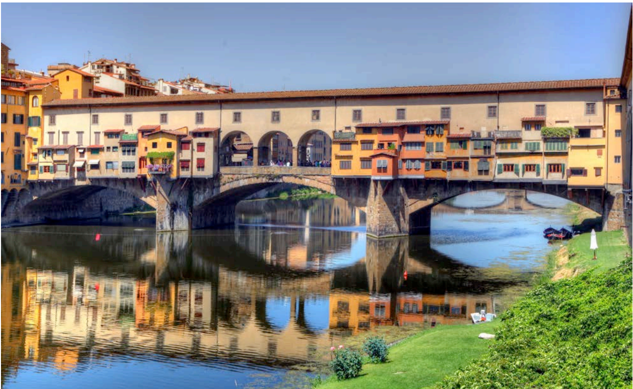
Enjambant l'Arno, le célèbre Ponte Vecchio, à la fois pont, rue piétonne, galerie marchande ...

On peut, de fait y admirer des toiles de Léonard de Vinci, Michel-Ange, Raphaël, Titien, entre autres.