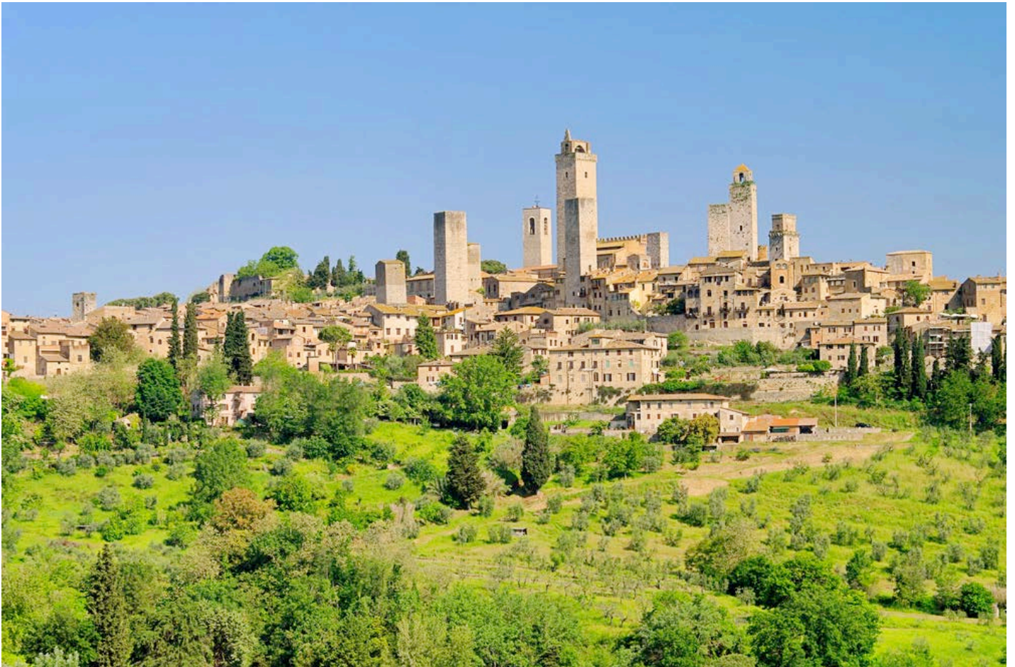
San Gimignano et ses 14 tours